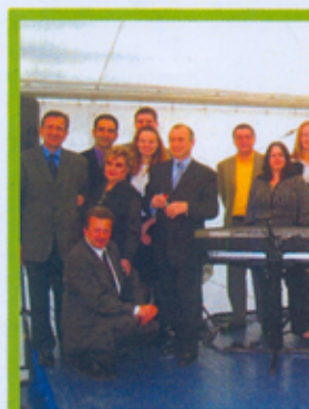
Myck Micheyl (à gauche au 2 e ) de la nouvelle agence de la L